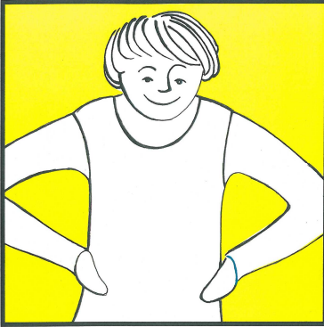
Ich trage Sorge zu mir.