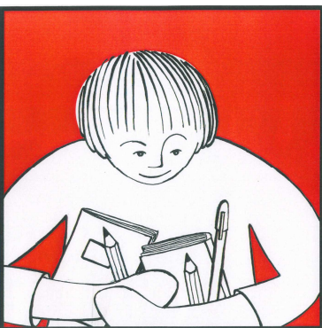
Ich trage Sorge zu den Dingen.